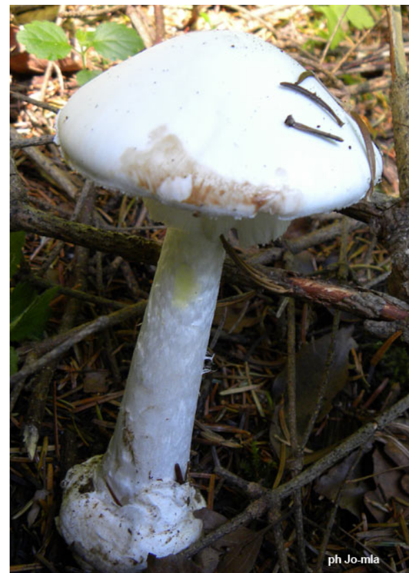
Amanita virosa (26/07/09) 70 Hte Saône (Combeaufontaine)

Chapeau 2,5x12 cm, lisse, forme irrégulière tronconique ou mamelonné blanc à ivoire à centre un peu ochracé en vieillissant.